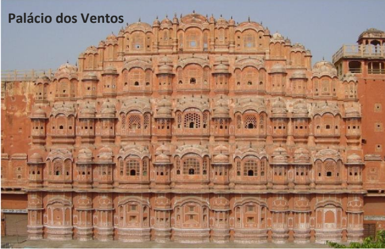
Palácio dos Ventos