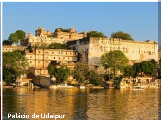
Palácio de Udaipur